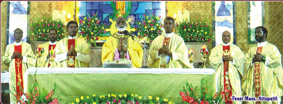
Feast Mass, Attupatti