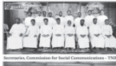
Secretaries, Commission for Social Communications - TNBC