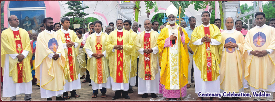
Centenary Celebration, Vadalur