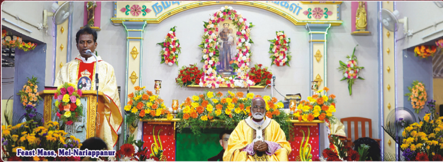
Feast Mass, Mel-Nariappanur