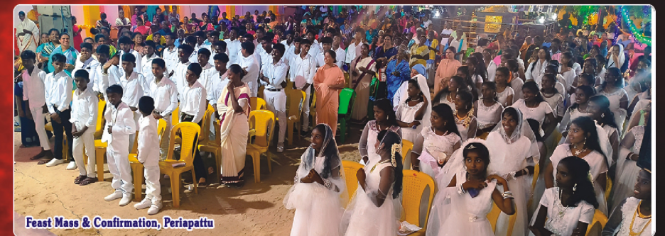
Feast Mass & Confirmation, Periapattu