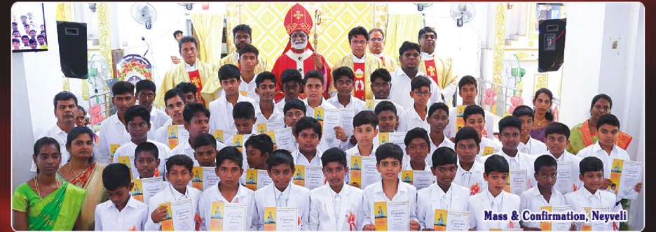
Mass & Confirmation, Neyveli