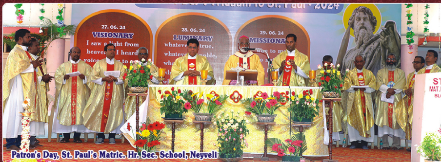
Patron's Day, St. Paul's Matric. Hr. Sec. School, Neyveli

Archbishop's House, Post Box No. 193, 206 Cathedral Street, Pondicherry 605001 Tel. 0413 - 2334748, 2339911. Facebook : PONDICHERRY ARCHDIOCESE E-Mail : archbishop@archdiocesepondicherry.com, dioceseofpondy@gmail.com Web : www.pondicherryarchdiocese.org, www.archdiocesepondicherry.com